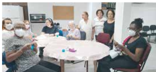
Aprendendo a fazer crochê