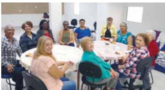
Confraternização da turma do crochê