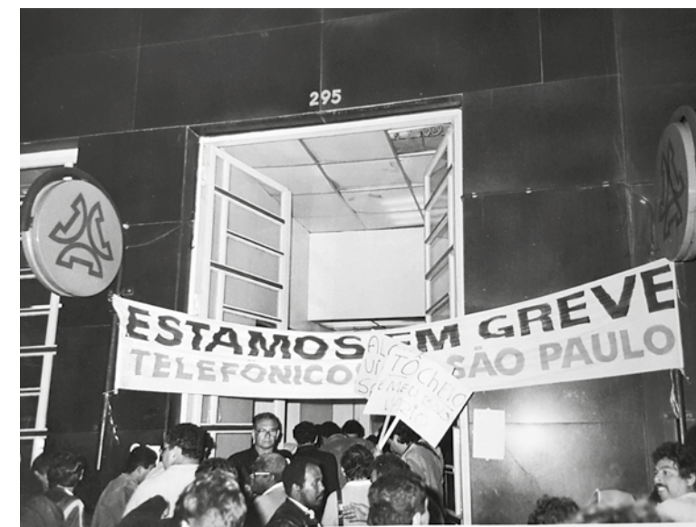
Greve de 1985