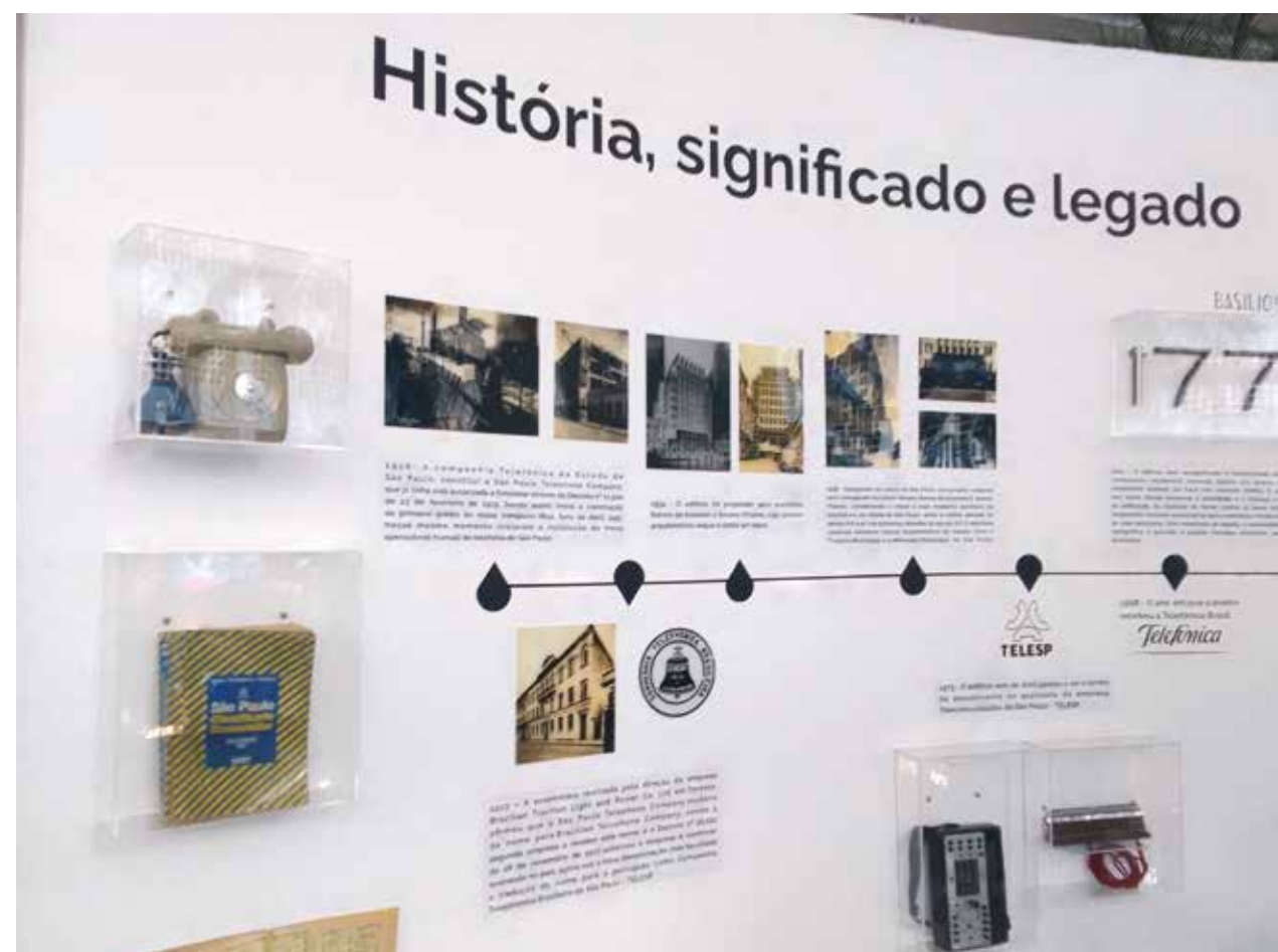
Exposição conta um pouco de história da telefonia

Em uma área de 4.502,84 m 2 , o edifício que antigamente era utilizado para fins comerciais terá mudança de uso. Parte dele será destinada à moradia e outra para atividades não residenciais.