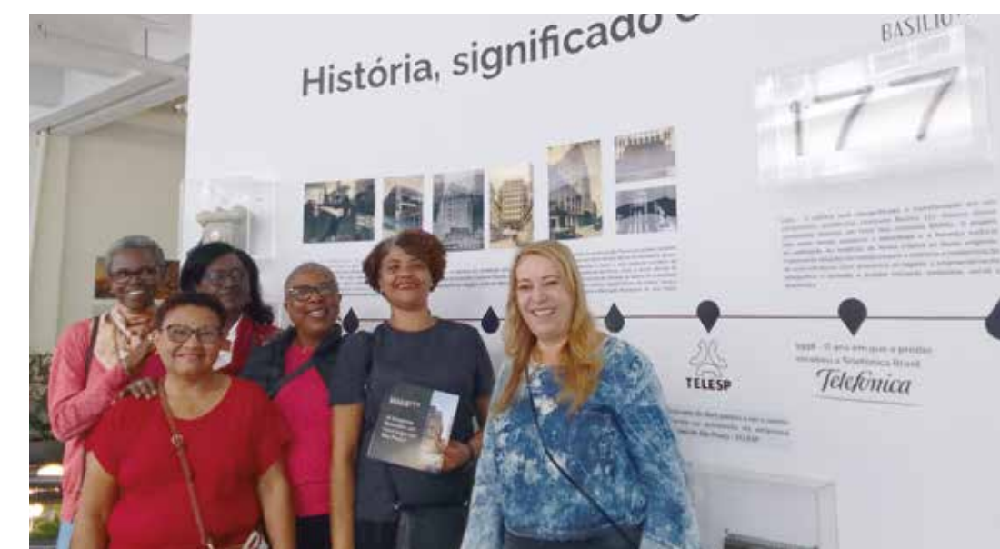
Telefonistas da antiga Telesp matam a saudade