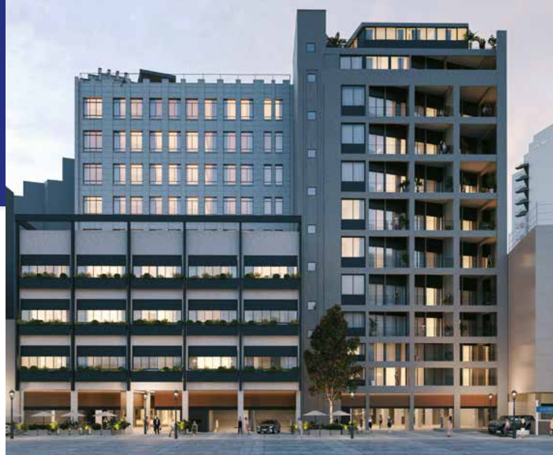
Fachada Rua Basílio da Gama - Foto: Metaforma

A Prefeitura de São Paulo, por meio da Secretaria Municipal de Urbanismo e Licenciamento (SMUL), emitiu o Alvará de Aprovação de Requalificação para retrofit do imóvel, por meio do Programa Requalifica Centro. A expectativa é de que o empreendimento volte a ter um papel de destaque na região, contribuindo para a recuperação do Centro.