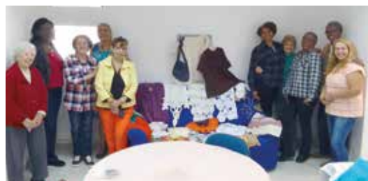
Trabalhos apresentados após o curso